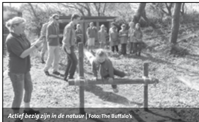
Actief bezig zijn in de natuur

Kampvuurtje stoken, tochten lopen en torens bouwen: dat is waar de meeste mensen aan denken als ze het woord scouting horen. Toch is scouting, vroeger de padvinderij geheten, veel meer dan dat! Om dat te bewijzen houdt scoutinggroep The Buffalo's uit Zandvoort op zaterdag 8 september een open dag.